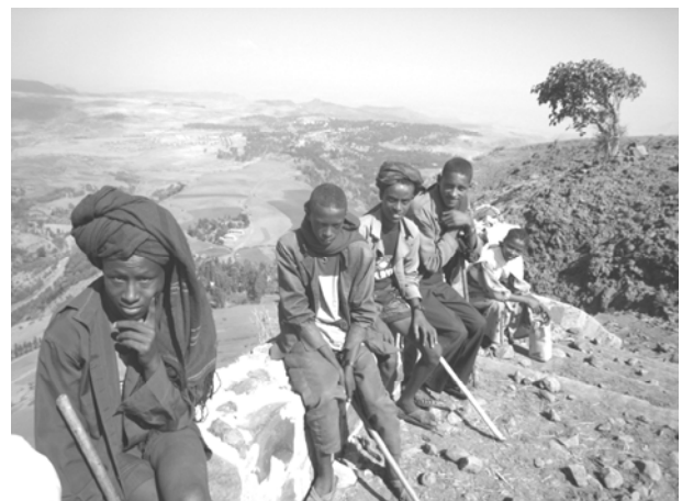
Hirten von Zoma, der Hochebene über dem Panorama von Alem Katema

Anfang 1995 besuchte unter Dinglers Leitung die erste Delegation aus Vaterstetten den damals nur mühsam erreichbaren Ort zwischen Jemma- und Wenchit-Tal. Für die Dorfältesten war alles neu: Der Partnerschafts-Gedanke, die Vorgehensweise zur Belebung der Idee und die Gründungs-Zeremonie. Letztere wurde ganz pragmatisch mit einem geschlachteten Lamm, viel Tej, Meta-Bier und einem Diavortrag über den deutschen Partnerort begangen.