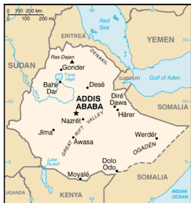
Karte Äthiopiens

Äthiopiens Regierung hat in den letzten Jahren ein anspruchsvolles Programm zur Energieversorgung in Angriff genommen. Entlang des Omo-Flusses im Süd-Westen des Landes ist eine Kaskade von vier Staudämmen (Gilgel Gibe I-IV) zur Stromgewinnung geplant (siehe Landkarten). Äthiopien will damit nicht nur die eigene Stromversorgung im Lande sichern, sondern wichtigster Stromexporteur der Region werden. Potentielle Kunden sind u.a. Kenia, Sudan und Djibouti aber auch fernere Länder wie Ägypten, Eritrea, Ruanda, Uganda und Tansania haben Interesse bekundet.