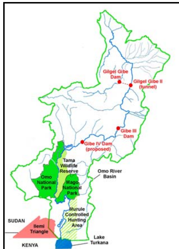
Karte des Omo-Tals

Environmental Social Impact Assessment (ESIA) by CESI & Mid Day International Consulting (MDI) Additional Study on Downstream Impacts by Agriconsulting & MDI Environmental & Social Management Plan by Salini & MDI Public Consultation & Disclosure Plan by Salini & MDI Resettlement Action Plan (vols 1 & 2) by MDI, Chida-Sodo Road Realignment by MDI Gibe III – Sodo 400kV Transmission Lines Project by EEPCo's Environmental Monitoring Unit (EMU) Gibe III – Sodo 400kV Transmission Lines Project and Resettlement Action Plan by EEPCo's EMU http://www.eepco.gov.et